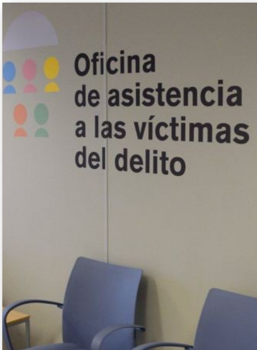
Imaxe dunha oficina de asistencia á vítima.